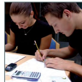
Planen und Umsetzen