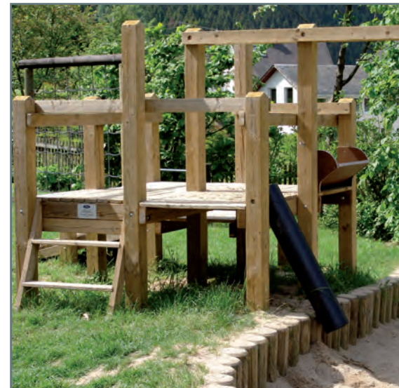
Komplexe Anforderungen erfordern komplexe Lösungen